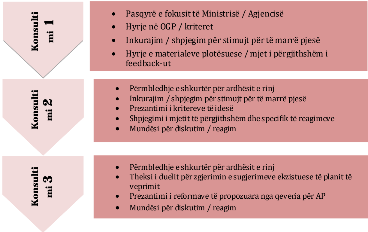
Figura 2: Struktura e përgjithshme e takimeve tematike të konsultimit me palët e interesuara